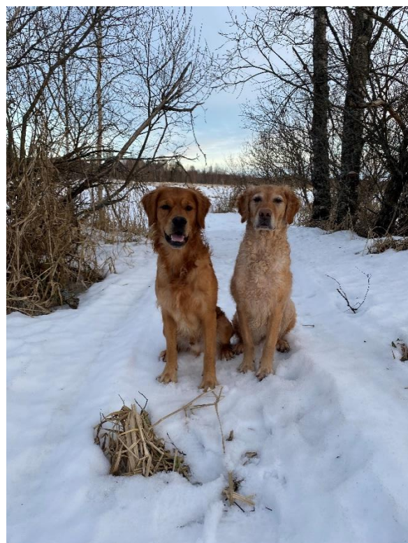
Kuvassa: Sisu ja Kuje