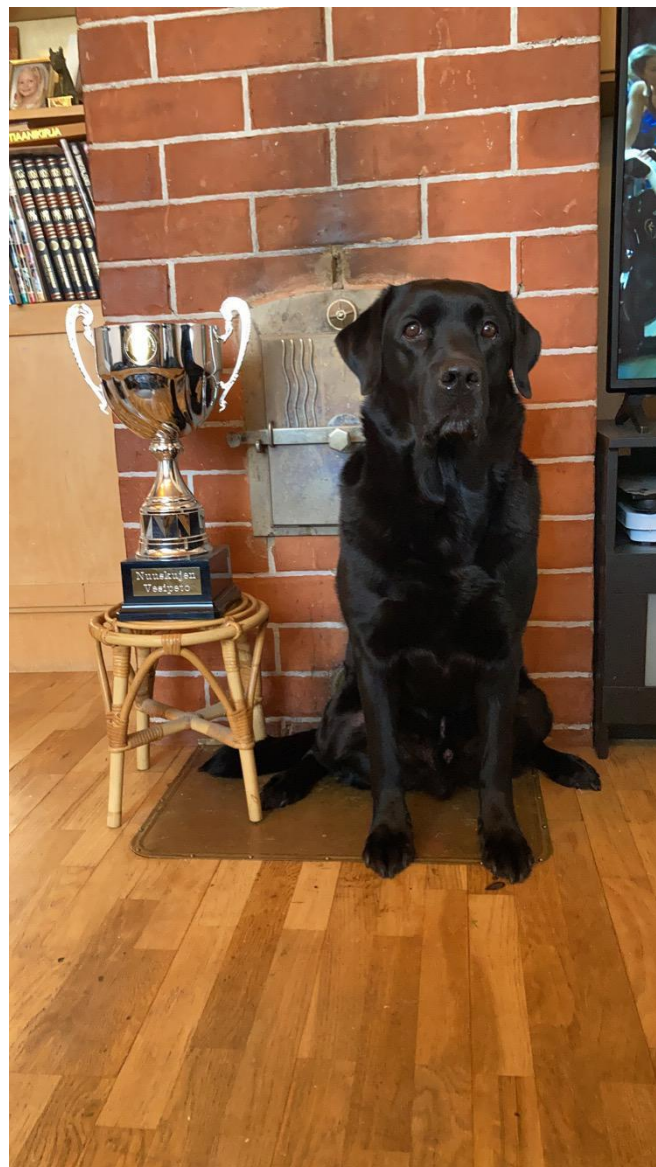
Kuvassa: Vuoden 2019 Vesipeto Reino

Kiertopalkinnot ja kunniakirjat sekä valiopalkinnot voi noutaa yhdistyksen toimistolta sunnuntaina 21.3. klo 12–14. Yhdistyksen toimisto sijaitsee osoitteessa: Teknikontie 10, Kangasala. Muista turvavälit ja käytä maskia!