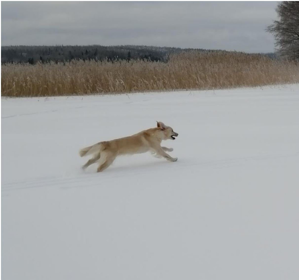
Kuvassa: Tardina's Delightful Madison "Lotta"